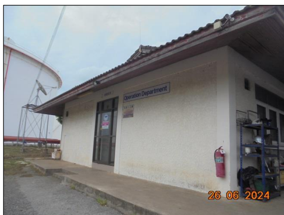
อาคารสำนักงานและทำแท็บเรือ