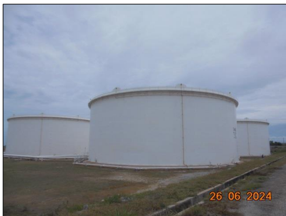
ถังเก็บน้ำมันภายในพื้นที่โครงการ